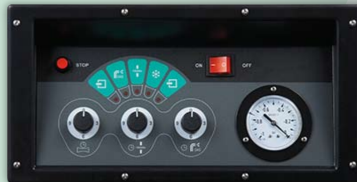
Panel de control electrónico: