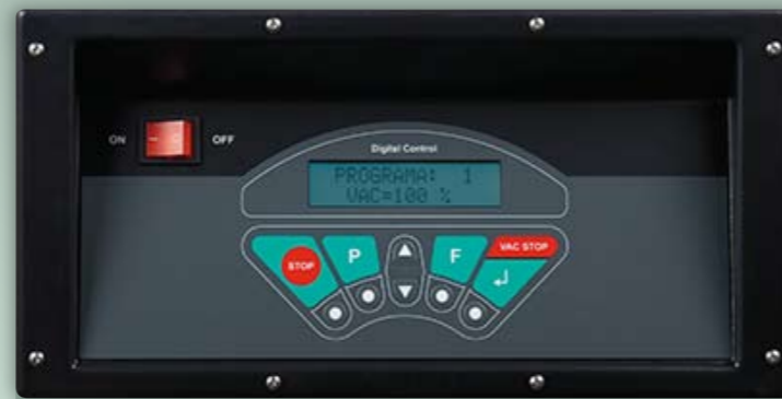
Panel de control digital: